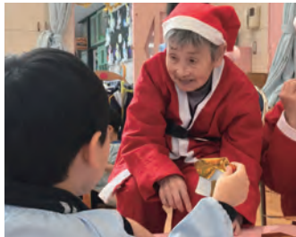
お年寄りとサンタになって保育園を訪問!

2019年12月13日(金)～15日(日) 参加費: 会員 15,000円 / 会員以外 17,000円 参加資格: アクティビティ インストラクターまたは アクティビティ ディレクター有資格者 定員: 10名 *釧路空港で集合・解散